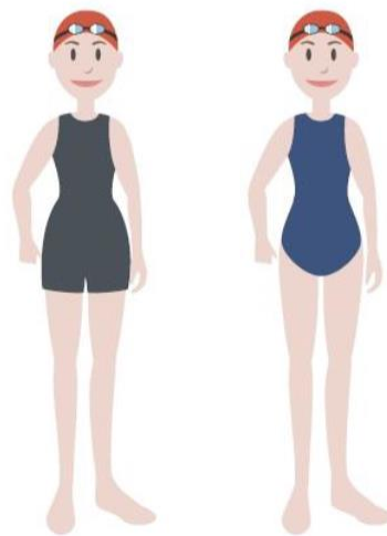
Figura 2. Exemplificação sobre os fatos permitidos para os nadadores cadetes e infantis femininos